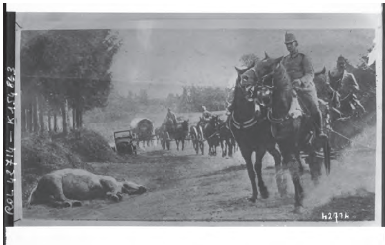
"Chevaux [cavaliers] autrichiens passant près d'un cheval tué à la bataille", (BNF), 1914